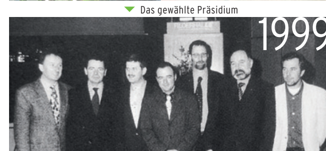
Das gewählte Präsidium