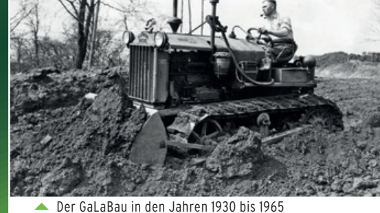
Der GaLaBau in den Jahren 1930 bis 1965